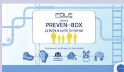
Équipements de protection individuelle